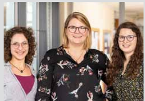
Kommen Sie mit - wir zeigen Ihnen das CuraZentrum Lavelshoh Seite 16