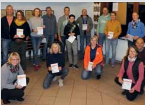
MTV Nordel: Sportabzeichen verliehen Seite 6